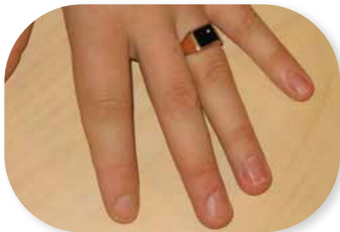
Foto 4. Vasaku II sõrme daktüliit ehk nn "viinersõrm" (vasak II sõrm on tunduvalt jämedam teistest sõrmedest).