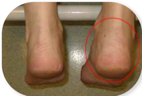
Foto 3. Parema kannakõõluse kinnituskoha põletik ehk entesiit.