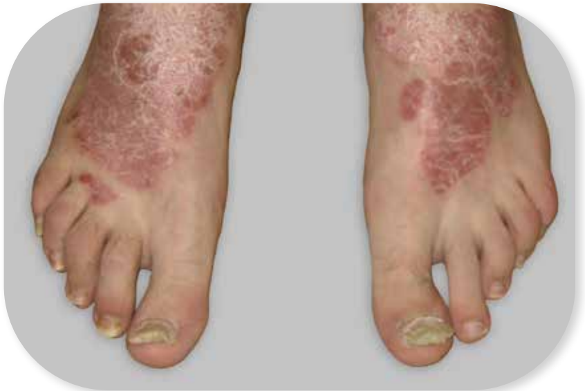
Foto 1. Tüüpiline psoriaasikahjustus nahal ja küüntel.

Psoriaas võib lisaks nahale tabada ka küüsi ning seda kuni pooltel juhtudel. Küünte kahjustust esineb sagedamini just psoriaatilist artriiti põdevatel inimestel (Foto 1). Mõnikord on küünte psoriaasi raske eristada seenhaigusest.