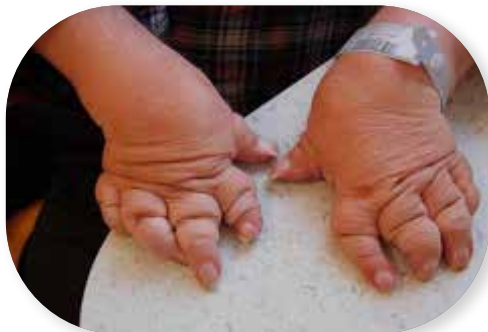
Foto 7. Mutileeriv artriit. Sõrmeliigeste kahjustuse ning luude sulandumise tõttu on tekkinud nn teleskoopsõrmed.

Kõige sagedamini esinevad asümmeetriline oligoartriit ja sümmeetriline polüartriit.