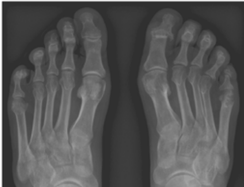
Foto 6. Tüüpiline psoriaatilise artriidi kahjustus paremal suure varba tipmisel liigesel ning parema V varba põhiliigesel kahjustus.

Vereanalüüsides võib esineda põletikunäitajate (SR ehk settereaktsioon ja/või CRP ehk C-reaktiivne valk) tõus, kuid põletikunäidud võivad olla ka täiesti normis. Reumatoidfaktor on enamasti negatiivne.