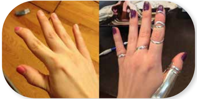
Foto 9. Sõrmeliigeste moondumiste vähendamine ning liigeste toetamine sõrmusortoosidega.

Mitmesuguste abivahendite (nt tallatoed, tugisidemed ehk ortoosid) kasutamine võib olla alguses harjumatu – seetõttu tuleb püüda nendega kohaneda, kandes neid esialgu ainult mõne tunni kaupa päevas (Foto 9).