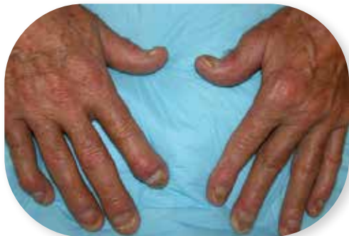
Foto 2. Sõrmede tipmist liigeste artriit koos küünete psoriaatilise kahjustusega.

Psoriaatilisele artriidile ainuomased analüüsid, mille alusel oleks võimalik haigust diagnoosida, puuduvad. Analüüse tehakse sageli hoopis teiste haiguste välistamiseks.